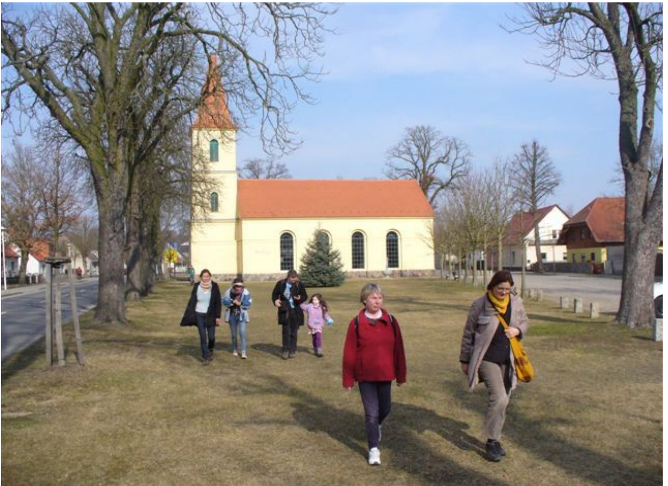
In Brisen hieß es: „Lass den Gedanken fallen“ - Ab hier wurde für gut eine Stunde geschwiegen. Gedanken, die kamen, wurden fallen gelassen. Schönes Wetter begleitete uns auf den 25km. Angenehme Erschöpfung machte sich in Fürstenwalde bemerkbar.